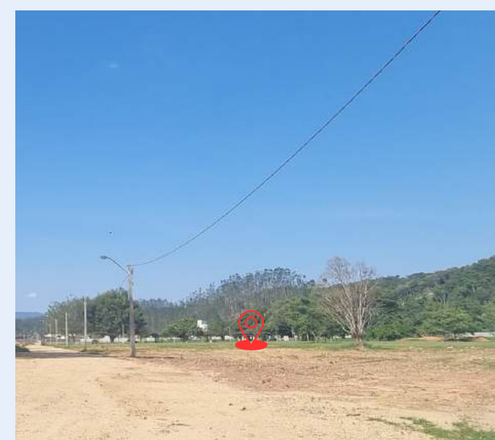
Imagem do local. Fonte: Dez/2023

Referência recorte do mapa de zoneamento do parque e implantação do labirinto. Dez/2023